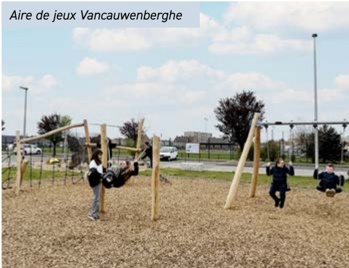
Aire de jeux Vancauwenberghe