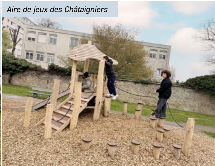
Aire de jeux des Châtaigniers