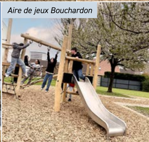
Aire de jeux Bouchardon