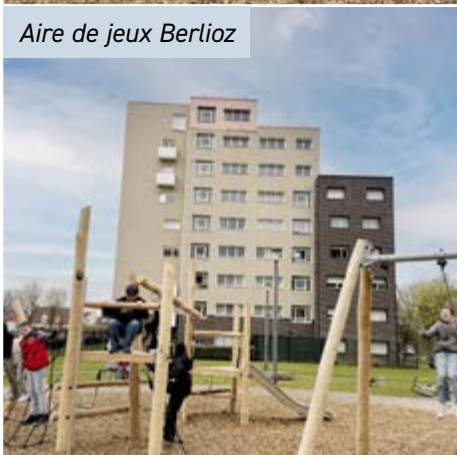
Aire de jeux Berlioz