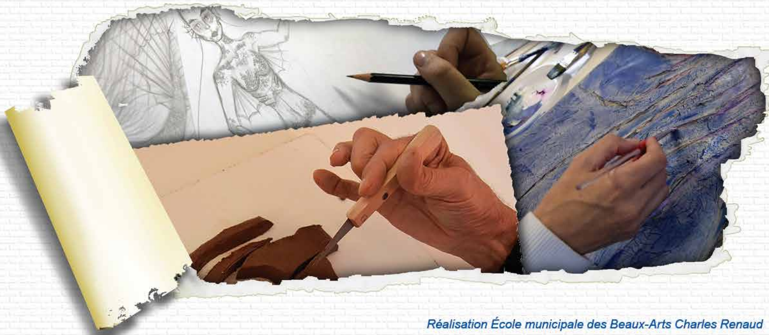
Réalisation École municipale des Beaux-Arts Charles Renaud